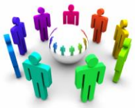
Tabla 9. Indicadores de Desarrollo, Área de Fortalecimiento Organizativo